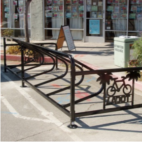
Cycle Stall - Elite