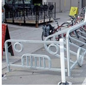
Cycle Stall - Car