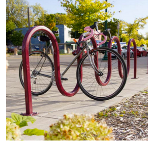
Broadway - 05 - 07 - 09