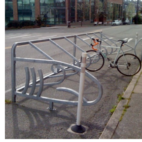
Cycle Stall - Fish